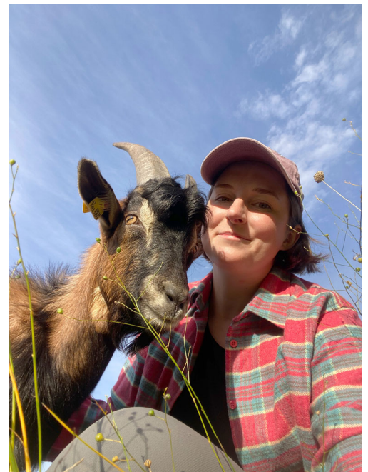
Weidelandschaft und ihre Managerinnen.

Wann: Samstag, 4. Juli 2026, ab 9:00 (Dauer ca. 8 Stunden). Anschließend gemütlicher Ausklang im Gasthaus Arbachmühle, https://www.arbachmuehle.at/ .