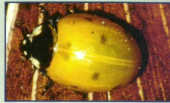
3.) Frischgeschlüpfter Siebenpunkt, noch gelb – langsam werden die Punkte sichtbar.