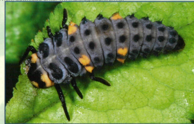
2.) Larve von Coccinella septempunctata