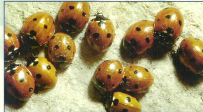
4.) Mehrere Exemplare des Siebenpunktes nach Verlassen des Winterquartiers im zeitigen Frühjahr

Naturnahe Landschaftsgestaltung fördert viele Insektenarten, natürlich auch den Siebenpunkt. Unter besonders günstigen Bedingungen kann er in ungeheuren Mengen auftreten. So wurden auf einem Getreidefeld in Schleswig-Holstein 235.000 Individuen/ha gefunden. Coccinella septempunctata unternimmt auch Ausbreitungsfüge. So wurde einmal ein Schwarm mit etwa 27–28 Millionen Exemplaren an einem 5 km langen Ostseestrand beobachtet! Eines der faszinierendsten Phänomene aus der Biologie der Coccinellidae ist die Bildung von Anhäufungen für die Überwinterung. Für einen einzigen solchen Überwinterungsplatz von Hippodamia convergens in Kalifornien wurde die Zahl von 42 Millionen Käfern berechnet. Die großen Individuenmengen dürfen nicht darüber hinwegtäuschen, dass das Vorkommen einiger Marienkäfer-Arten mit spezifischen Lebensraum-Ansprüchen in Österreich und Deutschland durchaus gefährdet ist. Die Gründe liegen in der Veränderung der geeigneten Lebensräume, wie trocken-warme Standorte, Moore und Heiden.