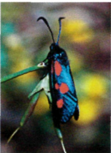
Abb. 1: Das Vorkommen des Sumpfhornklee-Widderchens ( Zygaena trifolii ) ist österreichweit auf wenige Fundstellen im nördlichen Vorarlberg beschränkt

Bizau, im oberen Feld, 680m, 16.6.2002, leg. U. Aistleitner (1 Stk.).