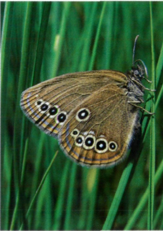
Abb. 2: Die Populationen des Moor-Wiesenvögelchens ( Coenonympha oedippus ) im Alpenrheintal wurden 1933 als ssp. rhenana beschrieben. Die letzte Beobachtung in Vorarlberg liegt trotz Nachsuche bereits 10 Jahre zurück.

Der Erstautor suchte zwischen 1999 und 2004 zur Hauptflugzeit im Juli immer wieder die ihm bekannten (teils ehemaligen) Flugstellen sowie die bei HUEMER (1996) aufgeführten Parzellen im NSG Bangs-Matschels in Feldkirch auf. Es konnte aber kein Exemplar mehr auf der österreichischen Seite des grenzübergreifenden Schutzgebietes gesichtet werden.