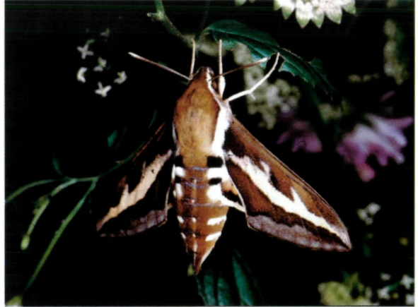
Abb. 4: Als gelegentlicher Einwanderer wurde der Labkrautschwärmer ( Hyles galii ) nach gut 40jähriger Nachweislücke erst jüngst wieder registriert