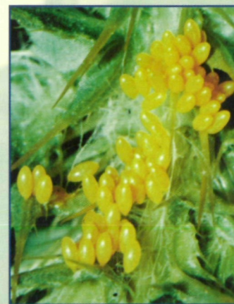
1.) Eigelege auf einem Distelblatt

Bei den anderen einheimischen Marienkäfern sind neben Blattläusen (Aphidina) auch Schildläuse (Coccina), Mottenschildläuse (Aleyrodoidea), Blattflöhe (Psylloidea), Spinnmilben (Tetranychidae), Wanzen (Heteroptera), Blasenfüße (Thysanoptera), Larven von Schmetterlingen, Käfern und Blattwespen, grüne Pflanzen, Pollen und MehltauPilze Haupt- oder Nebennahrung. Außerdem ist Kannibalismus, sogar Zwillingkannibalismus bei den Larven weit verbreitet. In Mitteleuropa ernähren sich die meisten Arten (68%) vorwiegend von Blattläusen, weltweit stehen aber die Schildläuse an der Spitze.