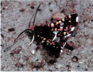
Abb. 3: Das Fensterschwärmerchen ( Thyris fenestrella ) entzieht sich leicht einer Beobachtung. Die Männchen lassen sich jedoch mittels synthetischer Pheromone anlocken.